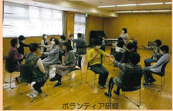
ボランティア研修

第二部の交流会は、3年度事業ボランティアの報告。唯一事業と言えるのが「ラッキースタープロジェクト」。