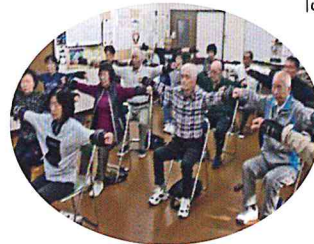
皆で集まって 百歳体操