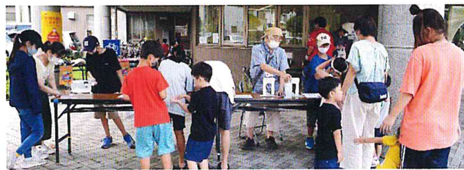
公民館前で配布した弁当はあっという間になくなりました。次回は9月23日(木、祝)

子ども100円大人300円の美味しい『ビタミン、愛』入り弁当は配布終了時間13時30分には、全てなくなりました。 ※ 新型コロナウイルス感染症対策のため今回はお弁当の持ち帰り対応となりました。