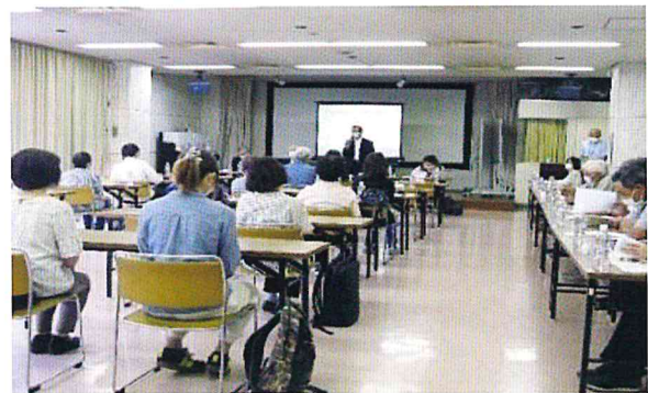
光が丘公民館の大会議室でコロナ感染症に気を付けて換気と座席間隔を取って行われました