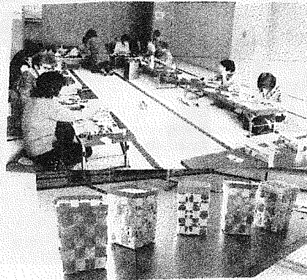
牛乳パックでペン立て 上手に出来ました