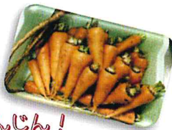
じゃが・たま・にんじん!