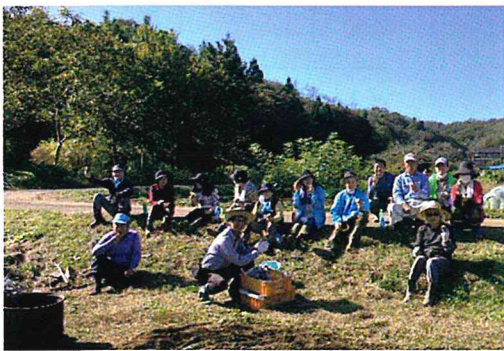
あつあつ、やきいもパーティー!

定期的な活動は原則 毎月第2水曜日 10時からです。(夏時間9時~) 野菜の生育状況によって、追加の活動や変更がありますので、参加を希望される方は、 ☎783-1212 に、お電話ください。