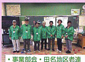
・事業部会・田名地区老連

11/19(土)田名小学校PTA主催「田名っ子フェスティバル」が開催され、田名地区社協はSDGsパートナーのつながりで「缶バッチ作り」と「ポッチャ体験」を企画し参加しました。2時間の開催中、参加する子どもの列は、ほぼ途切れることなく、用意した缶バッチのパーツが無くなりやむなく終了する程の盛況でした。ポッチャは子ども達にもわかりやすいよう若干ルールを変更し行いましたが、審査員のボランティアが休憩を取る間もないくらい盛り上がりました。