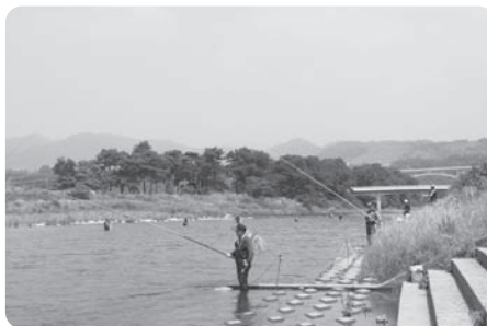
〈市社協ホームページより〉