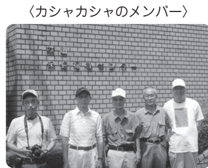
〈カシャカシャのメンバー〉

市社協ホームページ http://www.sagamiharashishakyo.or.jp/