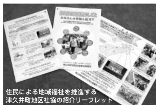
住民による地域福祉を推進する津久井町地区社協の紹介リーフレット

津久井町地区社協は、平成18年度から住民のみな様の参加と支えあいで運営(役員はすべて住民です)されています。この度、この地区社協の活動を「もっと分かりやすく多くの方々にお知らせできないものか」と、リーフレット作成委員会で話し合い、左写真のリーフレットを作成致しました。