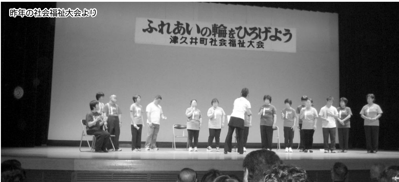
昨年の社会福祉大会より

昨年「ふくしの集い」を開催しました。高齢者や障害者、そして子どもたちにとって、安心して暮らせる地域をみんなの手で築きましよう。