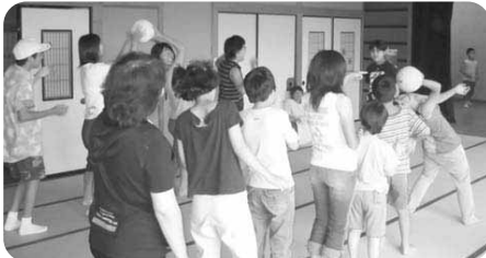
サマーカーブ活動の様子

活動内容は、子どもたちと一緒にプールで遊んだり、工作・ゲーム等をして楽しく1日を過ごしています。ボランティア活動がはじめての方や学生さんも大歓迎です。ぜひ、有意義な夏休みを過ごすためにも参加してみませんか?