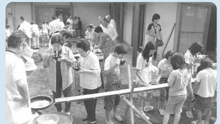
7月は毎年楽しみな「子どもとお年寄りの集い」を開催します。

現在32名の委員を中心に、地域の高齢者や障害者、子どもたちが共に親しみ、支えあえる地域にして行こうと、昼夜を問わず打ち合わせをして熱心に取り組んでいます。こうした人々に支えられた三井名手支部のやすらぎステーションは毎回、自治会の回覧を通して全戸に紹介され、いつも会場が満員になるほど好評です。