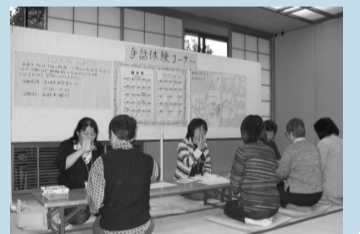
昨年度の手話体験コーナーより

問合せ：津久井町地区社会福祉協議会(市社協津久井町地域事務所内) 電話 042-784-3393