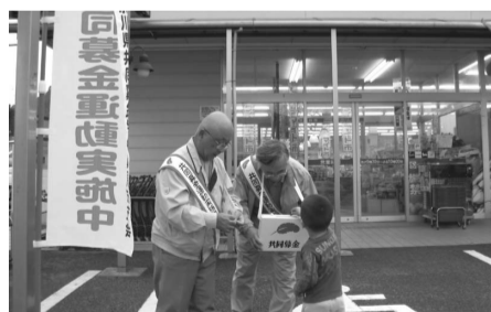
昨年度の街頭募金の様子